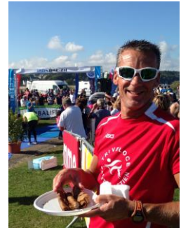
Kiki à Guidel : le secret de sa forme : Galette-saucisse !