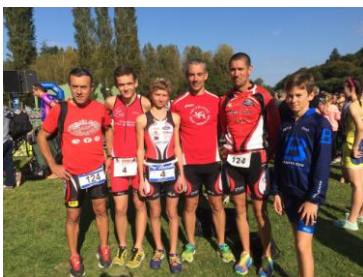
Jeunes et moins jeunes A Hennebont