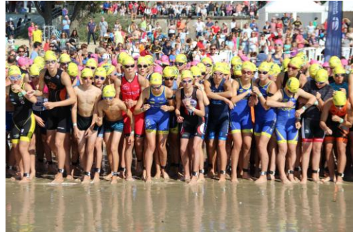
La Baule : départ des jeunes, mais où est Charlie ??