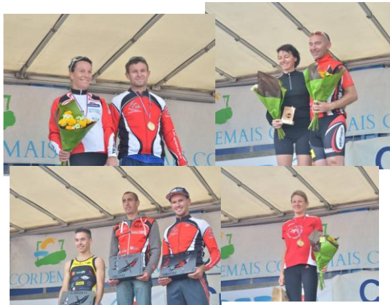
Des podiums en pagaille au Duathlon de Cordemais !