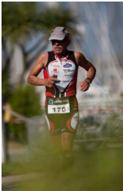
Dom à Cherbourg