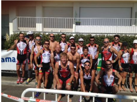
La Baule : belle brochette avant le départ du M