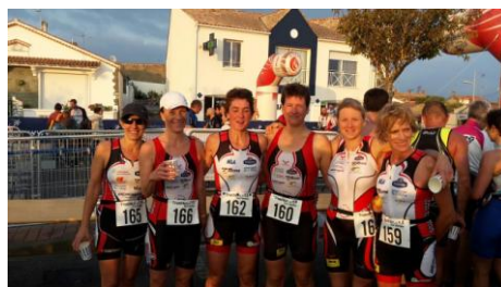
Les filles après le S de l'Aiguillon sur Mer